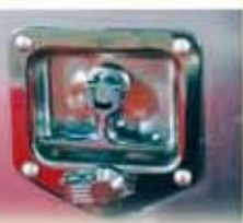
Serrure en T