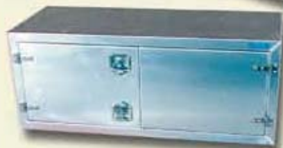
Coffres porte double